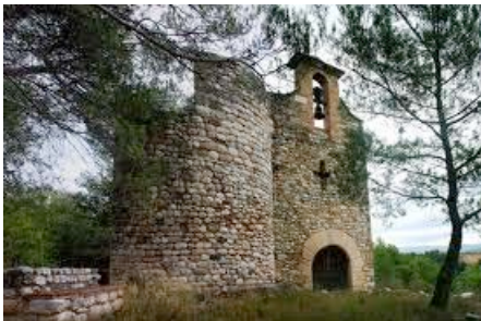
Sant Nicolau del Freixe, en un turonet molt a prop del riu Anoia

Des de Manresa agafem la crta. C-25 o Eix Diagonal cap a Igualada i Vilafranca. Deixem Igualada a la nostra dreta i, abans d'arribar a Vilafranca (passat el km. 32) agafem la BV-2304 cap a Canaletes, que deixarem també a la nostra dreta. Continuem tot recte en direcció a Sant Jaume Sesoliveres, on ens espera el nostre guia. Amb els cotxes tornem menys d'un quilòmetre enrere fins al trencall on els deixarem.