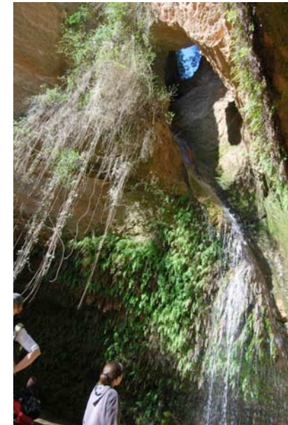
Salt del Cargol