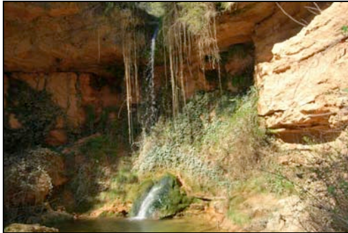
El Salt de la Mala Dona