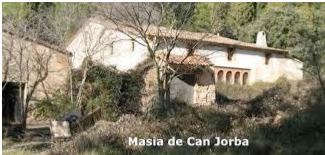
Masia de Can Jorba

Des del Bages agafem la crta. de Can Massana fins a enllaçar amb la N-2, sortint a la sortida del Bruc. Circularèm pel lateral de la via i en pocs metres passarem per davant d'un restaurant. Busquem el carrer Massana dins l'urbanització Bruc Residencial. Des d'allà veurem dues pistes. Tirant cap a l'esquerra, trobem uns indicadors que ens permeten anar cap a Can Jorba o la Vinya Nova. Agafem el camí cap a Can Jorba, punt des d'on comencem la nostra caminada.