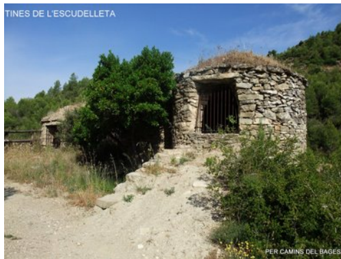
Tines de l'Escudelleteta