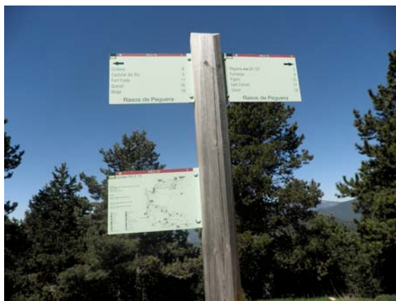
Indicadors del PR C-73