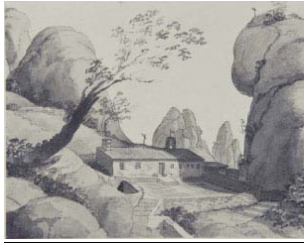
Imatge antiga de l'ermita de Santa Magdalena, destruïda pels francesos el 1812