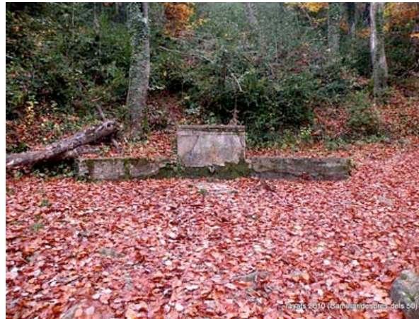
Font de la Seuva Negra