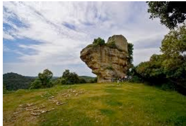
Castell de Popa

Prenem la pista que passa per sobre la casa i cinc cents metres després arribem a una bifurcació. Agafem el trencall de la dreta i passem pel costat d'un camp d'herba. On s'acaba el camp hi ha fites que assenyalen el sender fresat pel qual pugem directes al castell de Castellcir o castell de Popa, per la curiosa forma que té la roca on s'assenta el castell (runes del S. X).