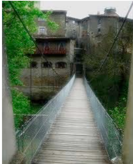
Pont penjant a Rupit.