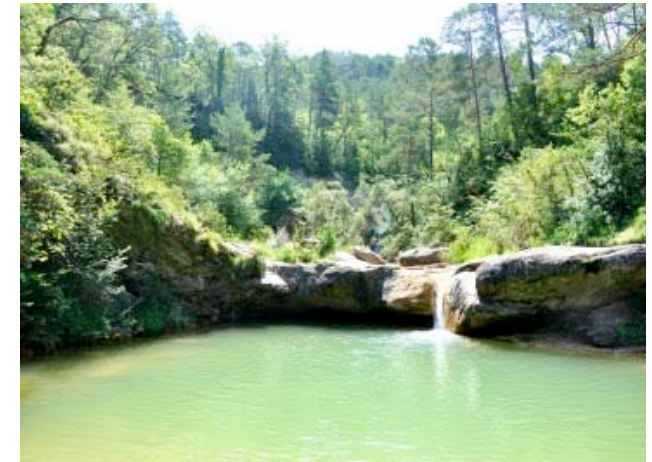
El Gorg de l'Olla