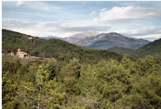
Sant Feliu d'Estiula -hi arribarem?

http://www.pisaterrones.com/2010/Archivos/02_Febrero/28_ruta184.htm