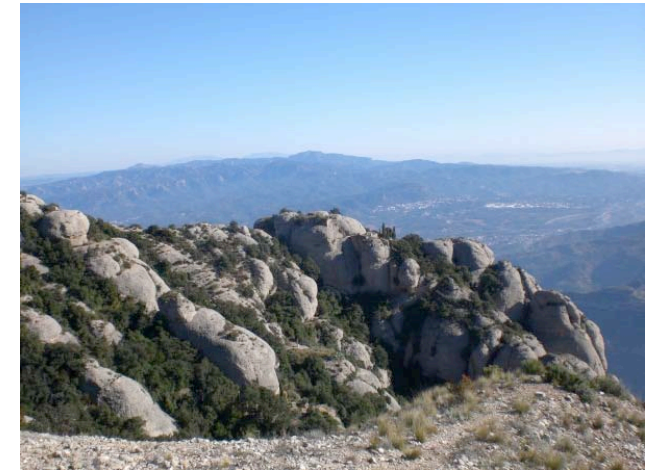
L'ermita de Sant Dimes