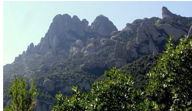
El camí de l'arrel, de Santa Cecília al monestir.