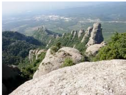
Els Pallers des de les Agulles

Per motius organitzatius es podrà limitar el nombre màxim de participants a les sortides segons el criteri de la persona de contacte. Es prega per tant, confirmar l'assistència a les activitats com a màxim el divendres abans de la data en que aquesta es dugui a terme.