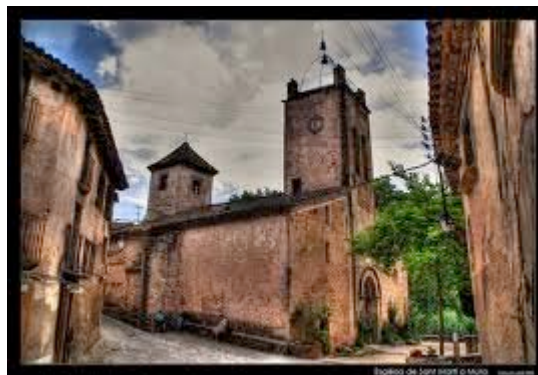
Església de Sant Martí de Mura

Per motius organitzatius es podrà limitar el nombre màxim de participants a les sortides segons el criteri de la persona de contacte. Es prega, per tant, confirmar l'assistència a les activitats com a màxim el divendres abans de la data en què aquesta es dugui a terme.