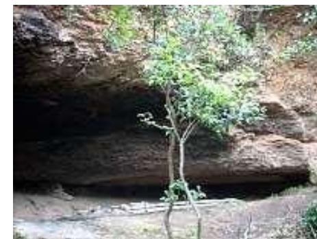
Cova de les Pruneres

Trobada: 18:30 h. a l' entrada del pàrquing del monestir de Montserrat. Algun cotxe es quedarà allà, algun altre a Santa Cecília i la resta a l'aparcament de Can Massana. Inici de la caminada cap a les 19:00 h.