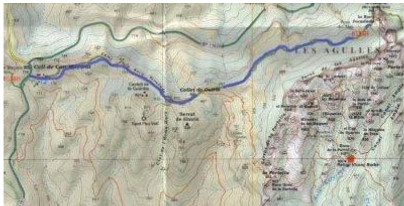
Mapa Can Maçana > Sant Jeroni

L'àrea d'aparcament i esbarjo de Can Maçana és al coll de Can Maçana, a l'extrem oest de la serralada de Montserrat, a la cruïlla de les carreteres BP-1103, que ve de Manresa, i la BP-1101, que és l'antiga carretera del Bruc.