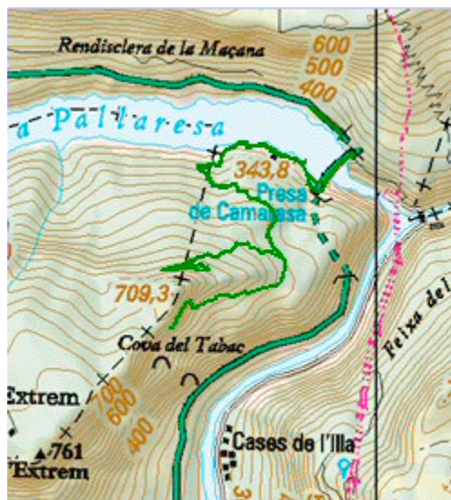
Mapa de la ruta

muntanya@centreexcursionistamontserrat.cat